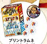
プリントラムネ おまけ缶バッジ

あの大人気フードコートがやってきた! EXILE他人気アーティスト考案の 歴代メニューの復活! 駄菓子・グッズも盛りだくさんで楽しさ満載。 忘れられない夏の思い出を!