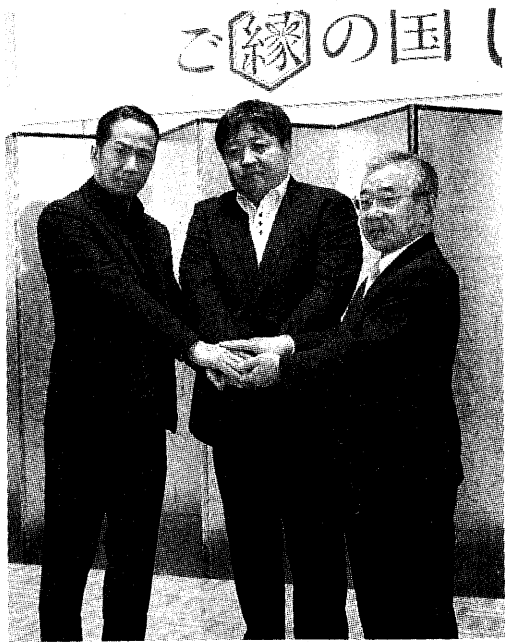
溝口知事、錦織監督と握手を交わすHIROさん(左) = 23日、県民会館大会議室

来年度から2年間、県が実施する「ご縁の国しまねプロモーション」の島根会見が23日、県民会館(松江市殿町)であり、EXILEなどが所属する芸能プロダクション、LDH社長のHIROさんが、出雲市出身で映画監督の錦織良成さんとともにプロモーションへの意気込みを語った。県は来年度、2013年度から行っている