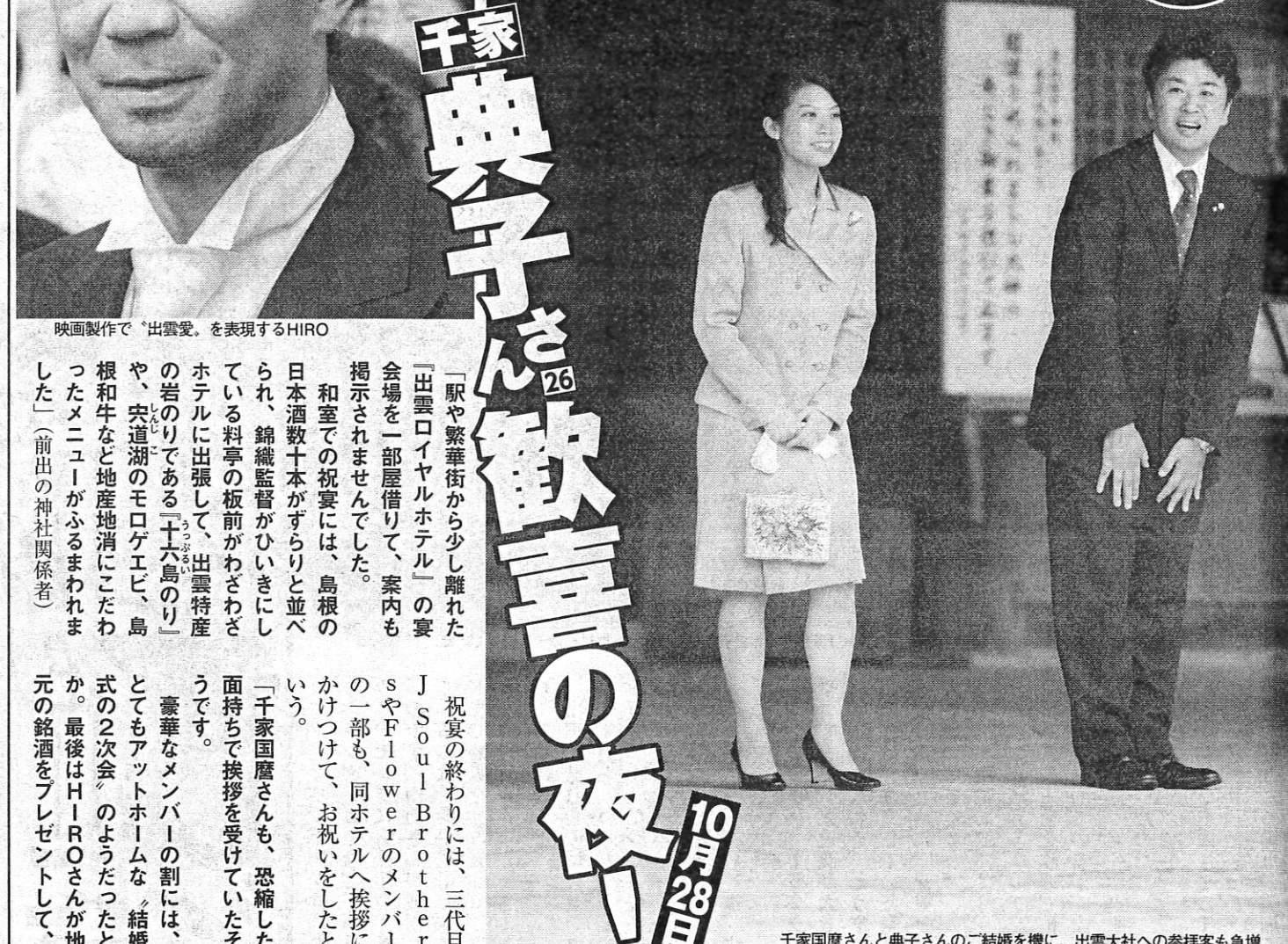
千家国麿さんと典子さんのご結婚を機に、出雲大社への参拝客も急増