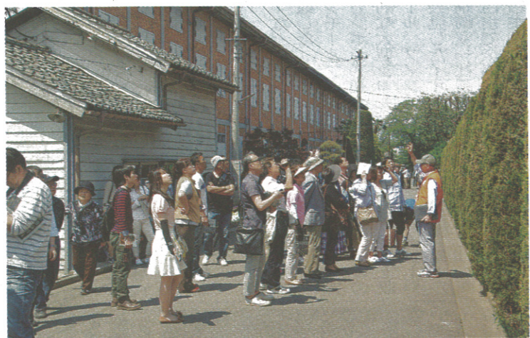
富岡製糸場には大型連休中に多くの観光客が訪れた(3日、群馬県富岡市)

【前橋】「富岡製糸場と絹産業遺産群」(群馬県)が6月にも世界文化遺産に登録される見通しとなり、同県内の温泉地は同製糸場などの連携に乗り出した。絹や養蚕に関するイベントの開催や関連商品の開発などが目白押しだ。世界遺産登録で製糸場の来場者は2倍以上に増えるとの予想もあり、来場者を温泉地にも呼び込む商機とみて、力を入れている。